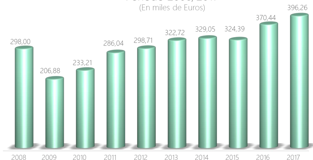
Evolución del Saldo Neto del Sector del Libro Período 2008/2017 (En miles de Euros)

Hay que señalar, además, que el sector del libro español tiene una fuerte presencia en los mercados exteriores. Las editoriales españolas cuentan con 209 filiales repartidas por el mundo cuyas cifras de venta no se incluyen en las cifras de exportación, lo que demuestra el extraordinario dinamismo y buen hacer de las más de 415 editoriales que tienen actividad de exportación permanentemente.